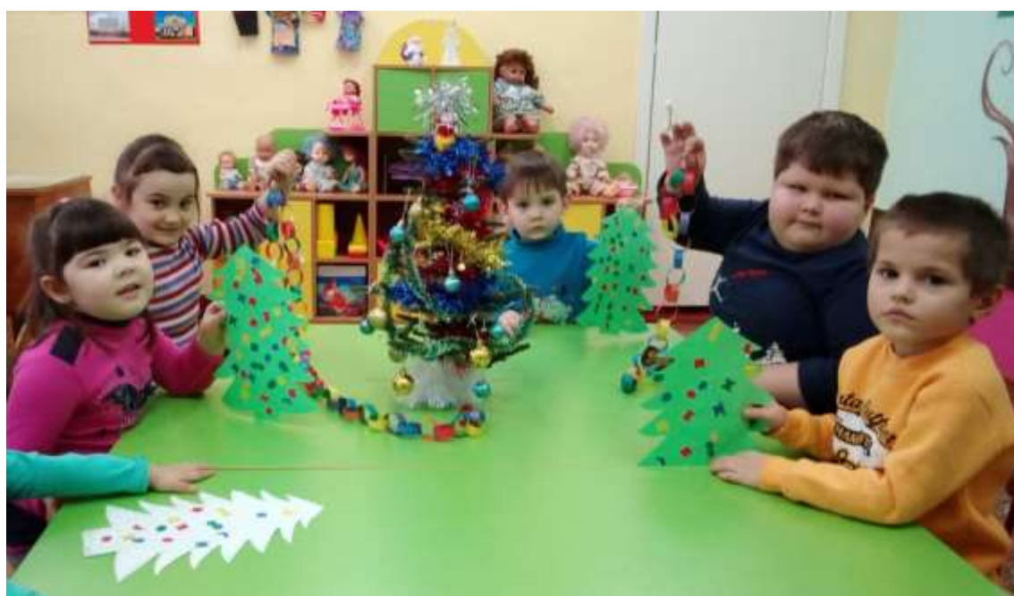
Совместное творчество детей с родителями