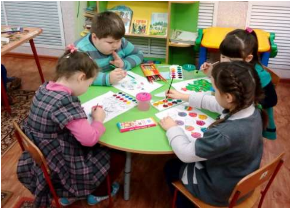
Мастерская Новогодних подарков